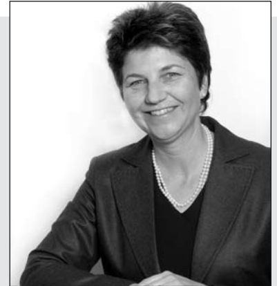
Viola Amherd , Stadtpräsidentin, Ressortverantwortliche Allg. Verwaltung sowie Bau und Planung

Das Ressort Bau und Planung umfasst den gesamten privaten und öffentlichen Hochbaubereich und die Bodenpolitik der Gemeinde, den Unterhalt und die Bewirtschaftung der kommunalen Liegenschaften sowie die Planung der Stadtentwicklung und der Verkehrskonzepte. In jüngster Vergangenheit war die Stadt mit einer starken Zunahme des privaten Wohnungsbaus konfrontiert, was Beweis für die anhaltende Lebens- und Wohnattraktivität der Gemeinde ist. Entsprechend wuchs die Bevölkerung allein im Jahr 2008 um 2% gegenüber dem Vorjahr und wir gehen angesichts der noch anstehenden Projekte auch in nächster Zeit von einem weiteren Anstieg aus. Seit der Revision des Zonen-nutzungsplans und des Baure-