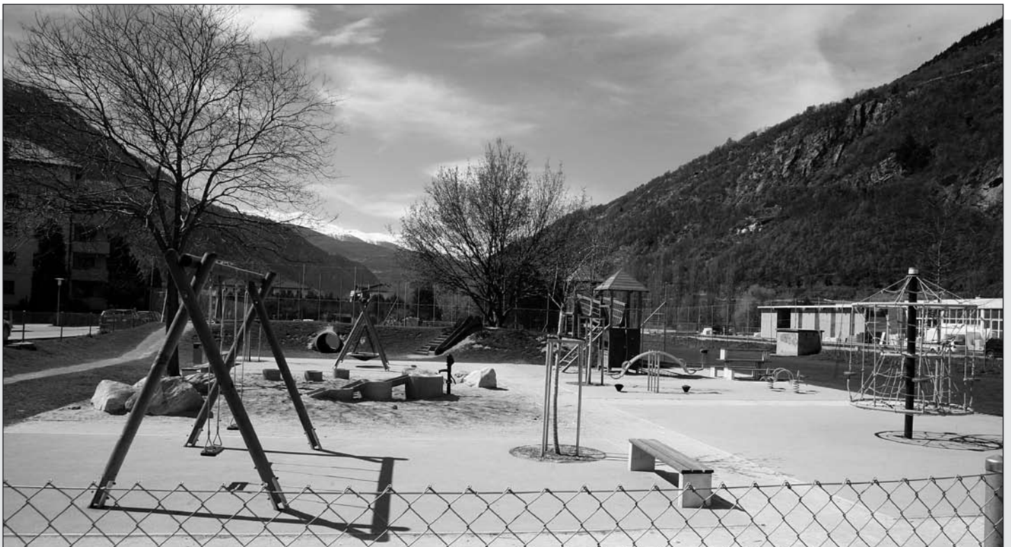
Der neu gestaltete Kinderspielplatz Englischgruss