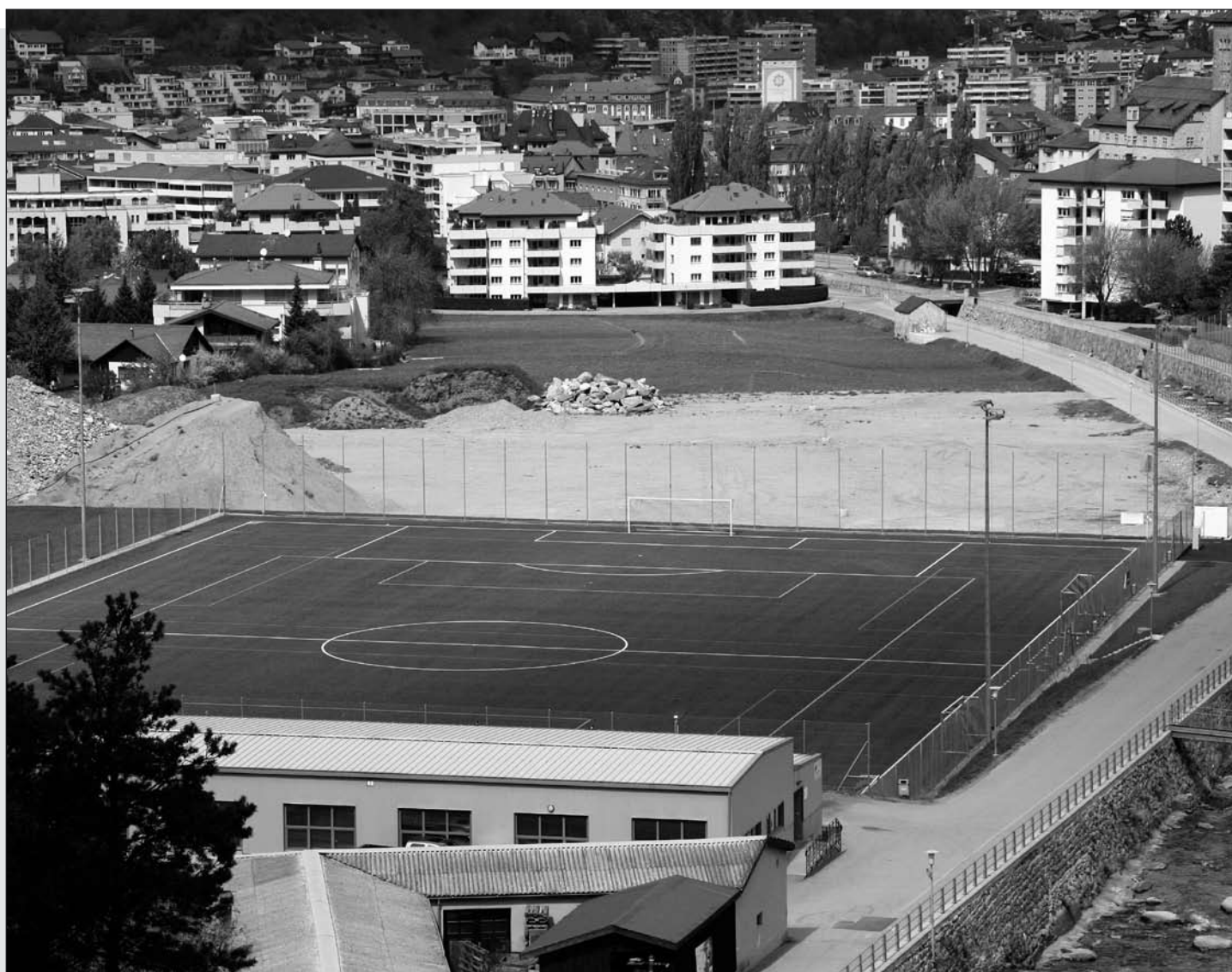
2010 stellte der Bau der Kunstrasen Anlage in der Geschina die grösste Investition dar.