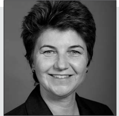
Liebe Mitbürgerinnen und Mitbürger

Der Gemeinderat traf sich in unveränderter Zusammensetzung an 21 Sitzungen zur Bewältigung der anstehenden Geschäfte.